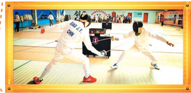
剑道上的精彩对决将登上读者节的舞台。