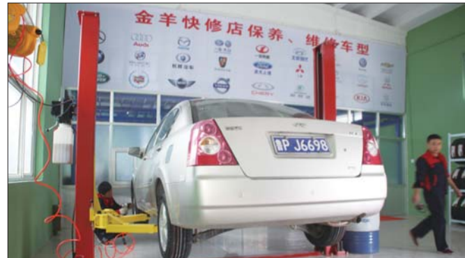
金羊快修店干净整洁。

山东金羊汽车服务有限公司24小时服务电话:0635-8780505。以专业化服务取代一站式服务,将传统的一站式服务细分成若干种专