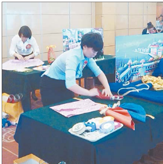
10月27日,山东省零售业营业员技能大赛决赛在济南举办,此次决赛共有130余名来自全省各地的选手参加。据了解,单项第一名选手将被推选申请“山东省富民兴鲁劳动奖章”。