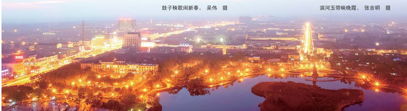
公园夜色。