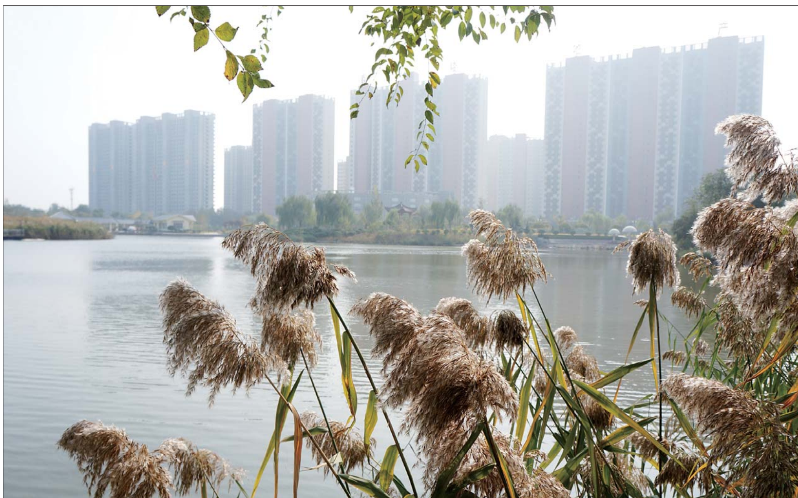
人民公园湖畔, 婆婆的芦苇与远处的楼宇组成一幅美丽的图画。