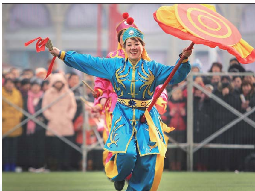
鼓子秧歌闹新春。