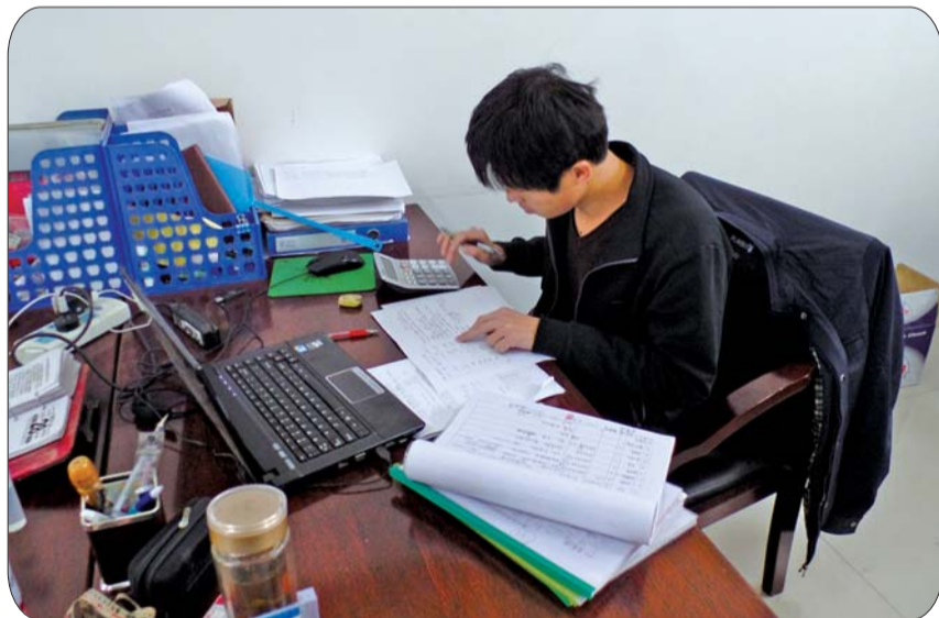
工作人员正在进行房屋及地上附属物的测算。

蚊虫叮咬,大家还是一如既往地从早晨6点40分就开始上路了,带上凉帽、涂上花露水,热火朝天地来到赵黑豆村,却发现有很多的农户不愿配合,一连走了三个胡同才遇到几个配合测量的人家,就这样,我们评估人员走了西家走东家,挨个耐心细致地为其讲政策,忙到中午,没休息一分钟,没喝一口水,还一直在坚持着。最后,功夫不负有心人,终于用真诚、耐心感动了村民,得到了村民的理解、支持和配合。大家虽然身心疲惫,但通过耐心细致讲解把新农村的政策宣传到千家万户,大家是欣慰的,也是值得的。就这样,我们带着感情,真诚、耐心地帮助搬迁户解决实际困难,公开、公平、公正地处理好农户的各种利益诉求,在政策规定的范围内全力维护搬迁户的正当权益,赢得了广大群众的理解、配合和支持!最大程度地保障了新农村社区建设后续工作的顺利进行,为物价部门树立了良好的形象。