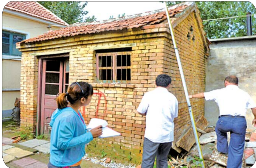
工作人员正在进行房屋及地上附属物的测量。

局党组还印制了《回访意见表》实行廉政回访,征求了解委托人和群众的意见,对价格认证人员工作有无违规违纪行为进行回访,实行严格监督。