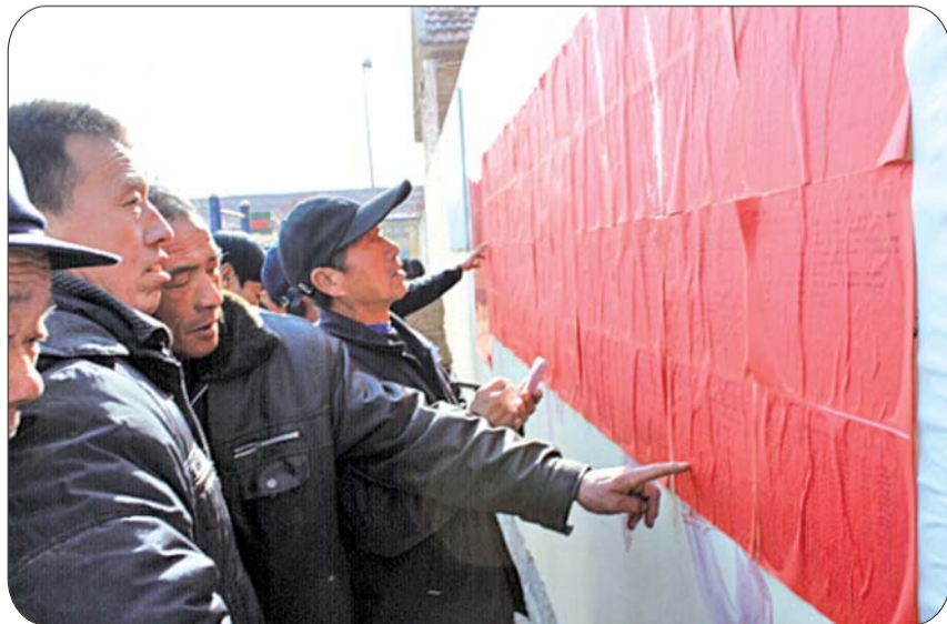
村民在看房屋认证结论的公示。

旧城亮起来了,市容美起来了;人晒黑了,但与群众的距离近了;腿跑累了,但与群众的心通了。正是通过这种贴心的服务,我们的工作人员赢得了广大拆迁户的满意,加深了人民群众对物价工作乃至政府工作的认可。