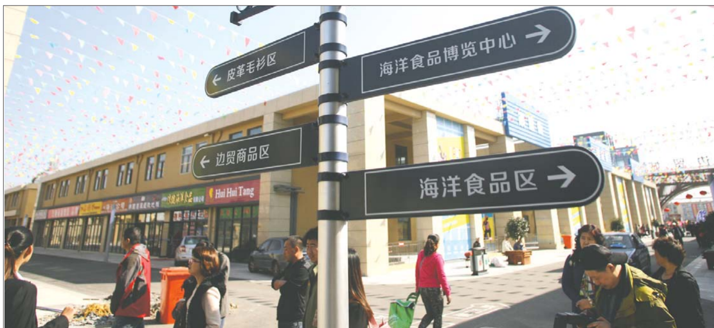
荣成站附近新建的中韩边贸城游客很多,熙熙攘攘。