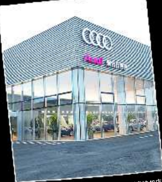
烟台百得利奥迪4S店