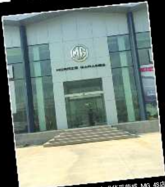
烟台大成华孚荣威、MG 4S店