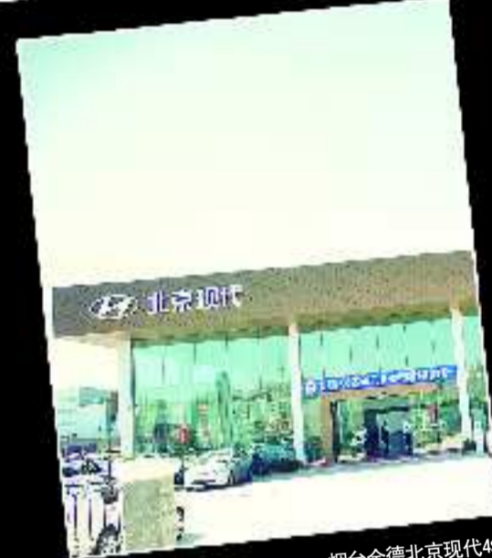
烟台金德北京现代4S店