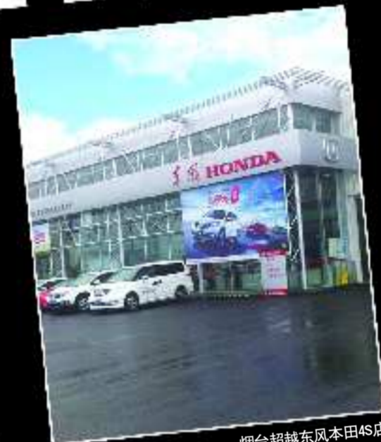
烟台超越东风本田4S店