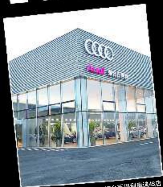
烟台百得利奥迪4S店