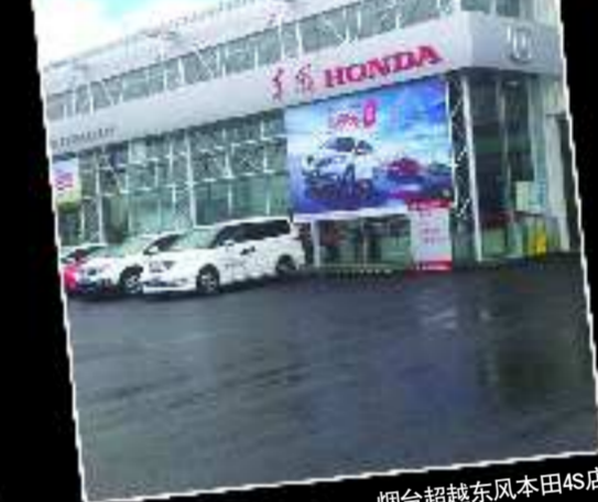
烟台超越东风本田4S店