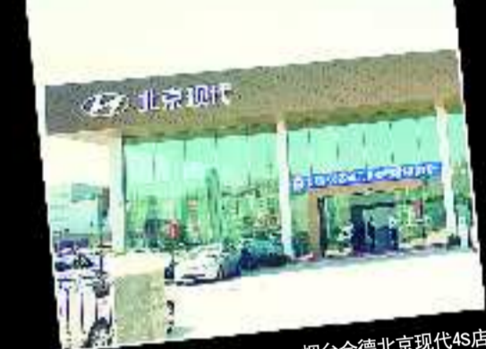
烟台金德北京现代4S店