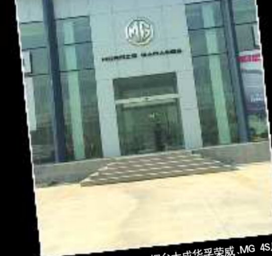
烟台大成华孚荣威、MG 4S店