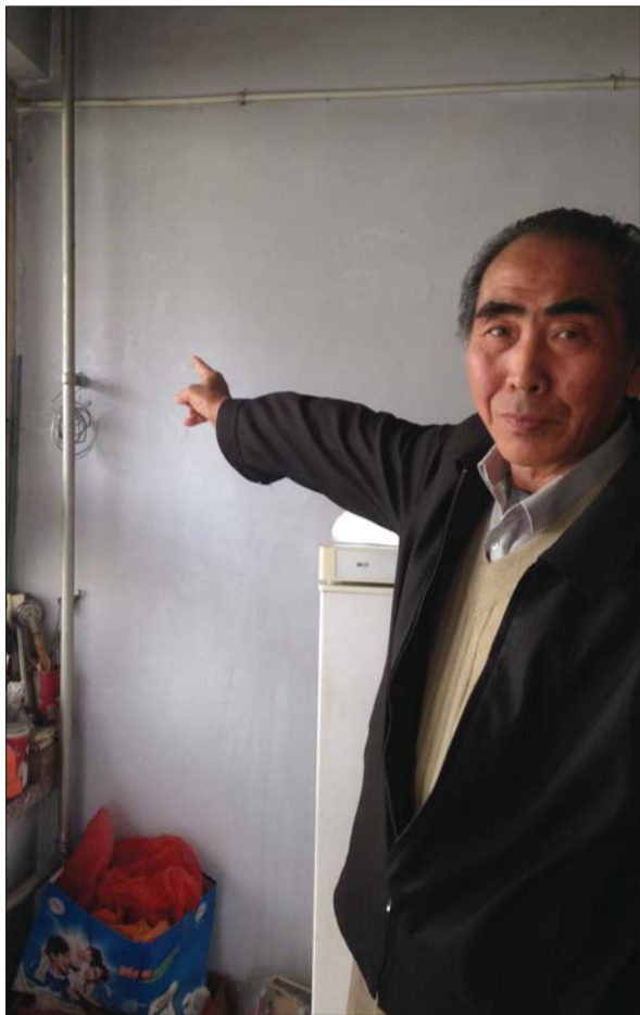
▲一位居民说楼下拆掉管道,全单元都供不上暖。 ▶热力公司的告知书,让居民自己协调管道问题。

到居民反映后,对管道情况落实,发现楼道里管道的产权是原泰安化工机械厂的,热力公司和该厂签的供热合同,他们已经发函给该厂的留守处,希望留守处出面协调。居民说眼看11月供暖季就要来了,希望有部门能出面协调,供暖开始之前把问题解决。