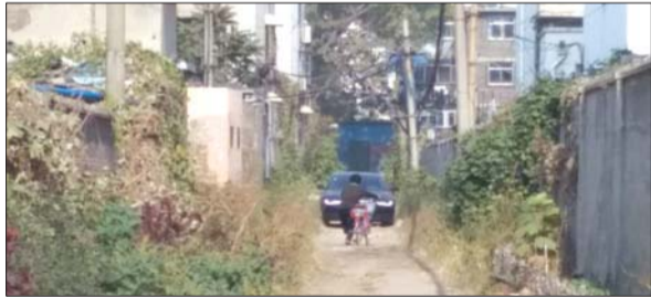
道路仅允许一辆车通行。

记者看到,泰安市农业机械科学研究所家属院位于南湖公园东侧,共有4栋上个世纪60年代修建的老楼,周围被多个新建小区环绕,没有直接通往公路的道路,居民经常走的是一条向西的不足3米宽的胡同。一个多星期前,由于热力公司维修地下管道,这条胡