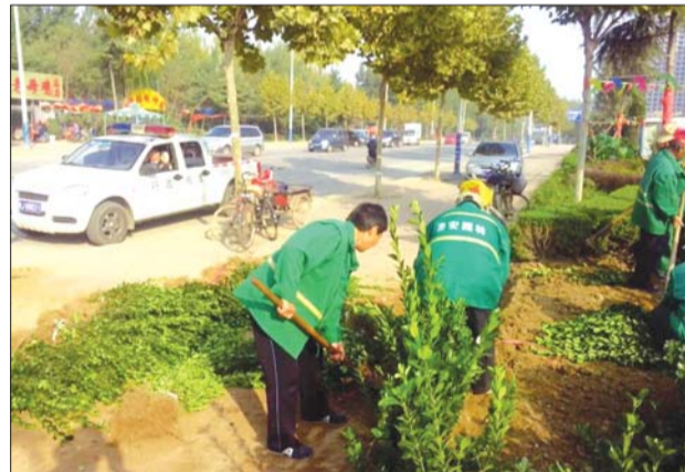
园林工作人员补栽冬青。

执法人员提醒,根据《城市绿化条例》第二十条、第二十八条以及《山东省城市绿化管理办法》第十八条、第三十二条的规定,对于未经批准,擅自占用城市绿化用地的行为,在责令限期退还、恢复原状后,可处以1万元以上10万元以下的罚款;造成损失的,还应当承担相关责任。