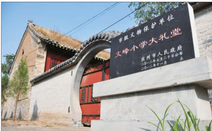
文峰小学大礼堂遗址。

毕的文庙，总体布局遵从儒家礼仪和宗法原则，强调居中为尊，整个结构为南北向三进院落，从南向北的中轴线上依次为棂星门、泮池泮桥、大成门、大成殿、明伦堂等，层层递进，起伏有致，是鲁北地区最大的一座儒家文化庙宇。它的门前是魁星阁和文峰台遗址，这里是最美的。一片宁静的湖水，湖边的芦苇在太阳光的映照下红艳艳的，秋风吹黄了苇叶，芦花却白得柔美，随风轻摇，此起彼伏，更像是泛起的一道道浪花。采下几支握在手中，这柔美就被随身携带了。岸边，几名穿着校服的学生正在说着悄悄话。