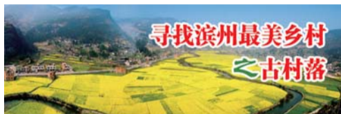
寻找滨州最美乡村 之古村落