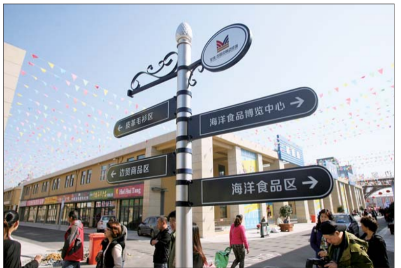
荣成站附近新建的中韩边贸城吸引不少游客前来。记者 王帅 摄

荣成是全国第一渔业大县,有着丰富的海洋资源,海洋食品产业基础好,规模大,并且是中国大陆距离韩国最近的城市,拥有石岛、龙眼两个国家一类开放口岸,城际铁路的开通更让荣成成为一个新时代的交通枢纽,荣成的海产品也将被更多人品尝到。