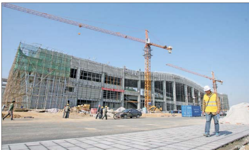
荣成站站房建设已进入装修阶段。记者 王帅 摄

据了解,烟台南站到荣成站约有120公里,途经牟平、威海北、威海、文登东到达荣成,通车后将大大缩短烟台到荣成的旅行时间。