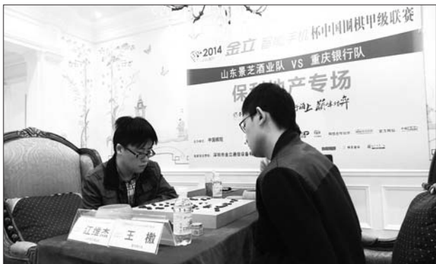
江维杰(左)没能抓住获胜的机会。

为了回应岛城棋迷的热情,山东景芝队棋手留下来举办第二天的车轮大战。11月1日上午9:30,在黄岛“保利·海上罗兰”楼盘内进行围棋国手擂台赛,三位世界冠军江维杰、周睿羊、范廷钰将轮番上阵,与岛城棋迷和业余棋手对弈,并为参与者签名留念。