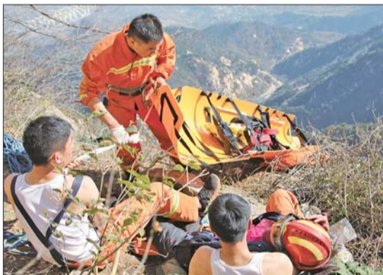
3日,救援人员将担架放下悬崖准备救援。

救援首日,夜间救援被迫中断,三名消防战士主动请缨爬下悬崖陪伴驴友,并不顾夜里零下10℃的低温,将外套脱给受伤驴友取暖,自己只着背心,一直到第二天支援队伍赶来,成功救出驴友。