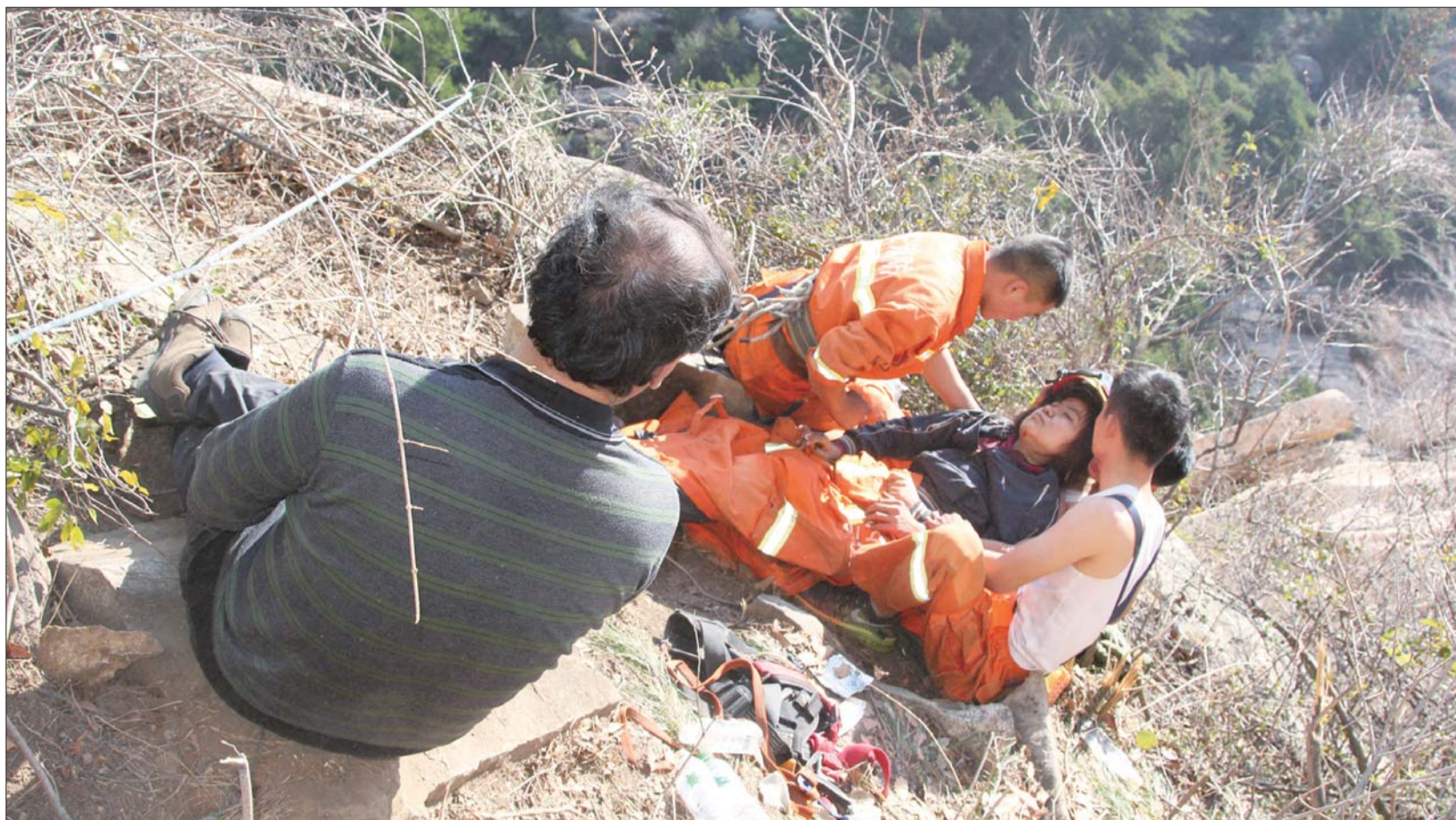
3日,陪两名驴友度过一整夜的消防战士照顾伤者,一名战士将外套盖在女子身上,只着背心。