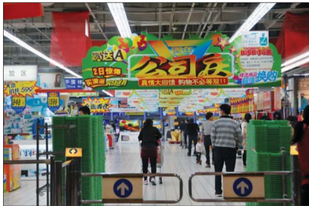
一大型超市推出了优惠政策,意图在“双十一”之前抢夺客源。

据介绍,自2009年以天猫、京东为代表的大型电子商务网站开展打折促销活动以来,对实体店的冲击尤其大,特别是服装和家电行业。仅就淘宝来看,五年以来的销售额一路飙升,分别为1亿元、9.36亿元、52亿元、191亿元、350.19亿元,此外业内人士还预计2014年淘宝交易额将达600亿元。