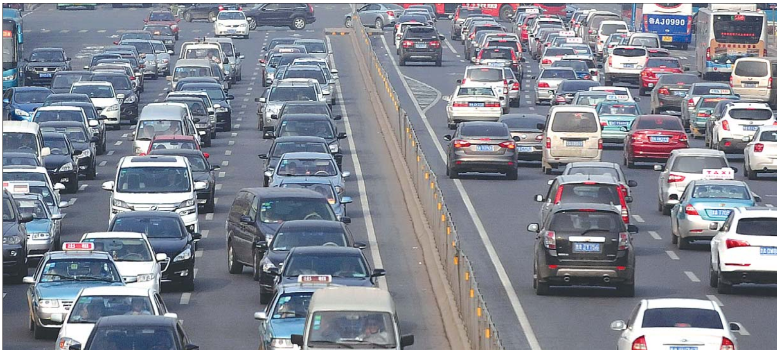
11月6日8点40分,济南经十路与历山路路口东侧路面,车流如潮,道路出现拥堵。