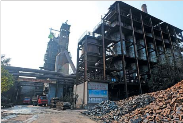
7日上午,庚辰钢铁厂设备已停工,烟囱不再冒烟。

这似乎说明,空气污染是可以治理的,最主要的是限制排放企业。当然,全市八成以上企业停产属特殊情况,如何在保障生产生活前提下同样做到,还需要政府政绩观和企业责任意识的转变。