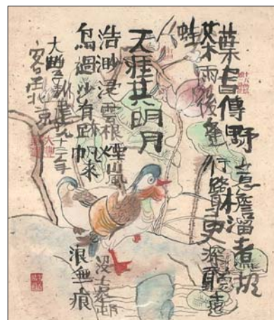
朱新建《天涯共明月》

在此次拍卖中,近现代书画仍然是主打。其中《中国书画精品专场》中将呈现齐白石、张大千、徐悲鸿、黄宾虹、吴昌硕、傅抱石、李可染、陆俨少、吴湖帆、谢稚柳、黄胄等大师珍品。而作为本次拍卖会的重头戏,拍卖会上将展现《丝瓜蜜蜂》、《东篱晚节》、《松竹梅三祝图》、《墨虾》、《芦雁》等16件白石老人的精品。傅抱石金刚坡时期的精品《早随烟月上瞿塘》、张大千的《荷叶田田》等作品都将展现在济南市民的眼前。