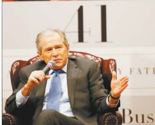
11月11日,小布什新书《我的父亲:第41任美国总统》在得克萨斯州举行发布会。图为小布什在新书发布会上,背景为其父亲的照片。