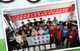
抱犊山景区前合影留念