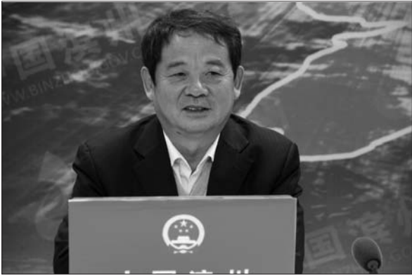
市教育局党组书记、局长高中兴做客在线访谈。