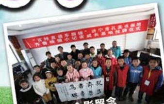
和书法家合影留念