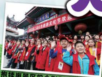
抱犊山景区前合影留念