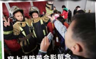
穿上消防装合影留念