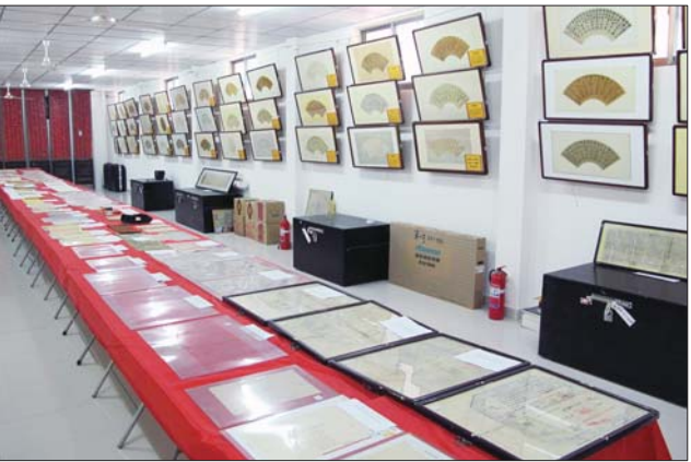
东阿魁丰博物馆展示的状元字画。