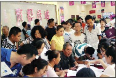
临近开盘,每天都有不少客户来京都商城洽谈、挑选看 赁

京都商城地处快餐财富圈,是聊城商业核心区,财富旺铺可遇而不可求。10—20平方米灵动小铺,20—128平方米稀缺旺铺,随意挑选。30年快餐商圈成熟商铺,投资价值无忧。拥有京都商城财富旺铺,风险小,回报高,价值高,打易易。 尤其是11月初,京都商城特邀电商巨头阿里巴巴的专家,为客户讲解互联网时代下的商业新模式,根据客户属性提供正确的营销策略,再加上京都商城项目优越的地铺位置、布局合理的业态,先进正规的物业配套,更加强了投资者和投资者对京都商城项目的信心。明日,财富大门即将开启,黄金旺铺、日进斗金,仅剩最后的预约机会!