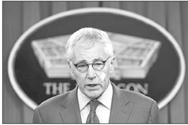
14日，在华盛顿，美国国防部长哈格尔脸上贴着创可贴出席记者会。