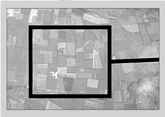
▲发射导弹的战斗机。