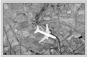
▲俄媒称，这架波音777飞机就是马航MH17航班。

据新华社11月15日电 俄罗斯国有的“第一频道”电视台14日发布一张据信为马航MH17航班坠毁前最后时刻的卫星图片，显示MH17航班飞经乌克兰东部地区时，一架战斗机曾出现在客机附近。俄方多名专家据此推断，MH17航班遭乌克兰一架战斗机发射的导弹击中坠毁，而非被地面发射的导弹击落。