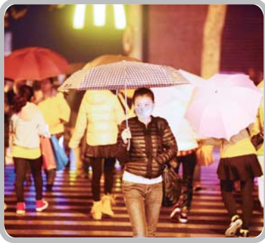
▲15日入夜时分,济南迎来今冬第一场冬雨。其实冬雨也温柔,女孩在街头撑伞而行,虽是冬日却有几分诗意。

校长刘金霞介绍,学校充分利用家长资源,开展了“家长进课堂”活动,并一步步发展到今天的社团活动,各班家委会牵头,以家长资源为依托,班主任老师辅助配合。当前,家长资源已作为一种重要的教育资源被引入学校教育,家长不同的职业背景,成功的育儿经验,鲜明的个性特征,成为学校有效教育资源的来源之一。 对此,刘金霞表示,以班级特色社团为载体,充分利用有利于学生发展的社会资源,为学生们提供了一个“学校课程大餐”之外的“特色课程小甜点”,这是对课本知识的延伸和拓展,是同学们认识社会,了解各行各业的一种途径,更是家长和学校的有效合作。