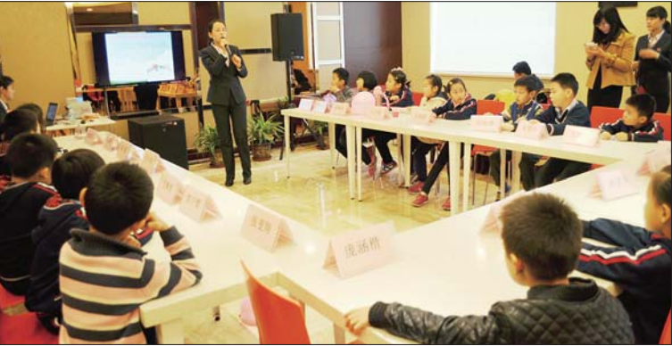
▲15日,山师附小一年级4班的孩子来到广发银行济南分行营业部上了一堂理财课,通过小游戏让孩子们学会“小鬼当家”。

本报11月15日讯(记者 王光营)别人有啥就闹着要,孩子乱花钱让很多父母头疼不已。15日,山师附小一年级4班的孩子上上了一堂理财课,通过小游戏让孩子们学会“小鬼当家”。 “钱是银行打印出来的”、“是爸爸妈妈上班挣的”……15日上午,当广发银行济南分行营业部的培训老师问到钱是怎么来的,来自山师附小一年级4班的20多个孩子就举起了手,争着抢答。 在“点钞大赛”活动中,培训师先将小朋友们分成A、B两组,一起认识人民