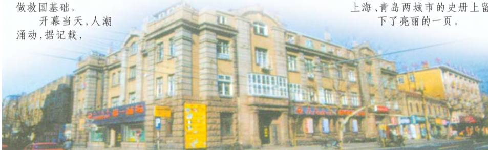
青岛国货展览会河南路商品陈列馆第一会场旧址老建筑。

来自上海产的服饰品、化妆品、日用品、饮食品、棉织品等物美价廉,受到青岛市民的青睐,人们纷纷掏钱购买。在川流不息的人流中,人们大包小包往家携带带有上海产地标志包装的各色商品,成为岛城街头一道亮丽的风景。同时,上海各工厂为了报答青岛市民对上海产品的喜爱,纷纷面向顾客推出优惠销售措施,如上海中国化学工业社在青岛国货展览会举办期间,规定凡顾客购买其生产的“三星牌”各种化妆品、牙膏、蚊虫香、爽身粉等产品满大洋5角者,赠送小号白玉牙膏一支,优惠举措一经推出,每天在上海中国化学工业社展屋前