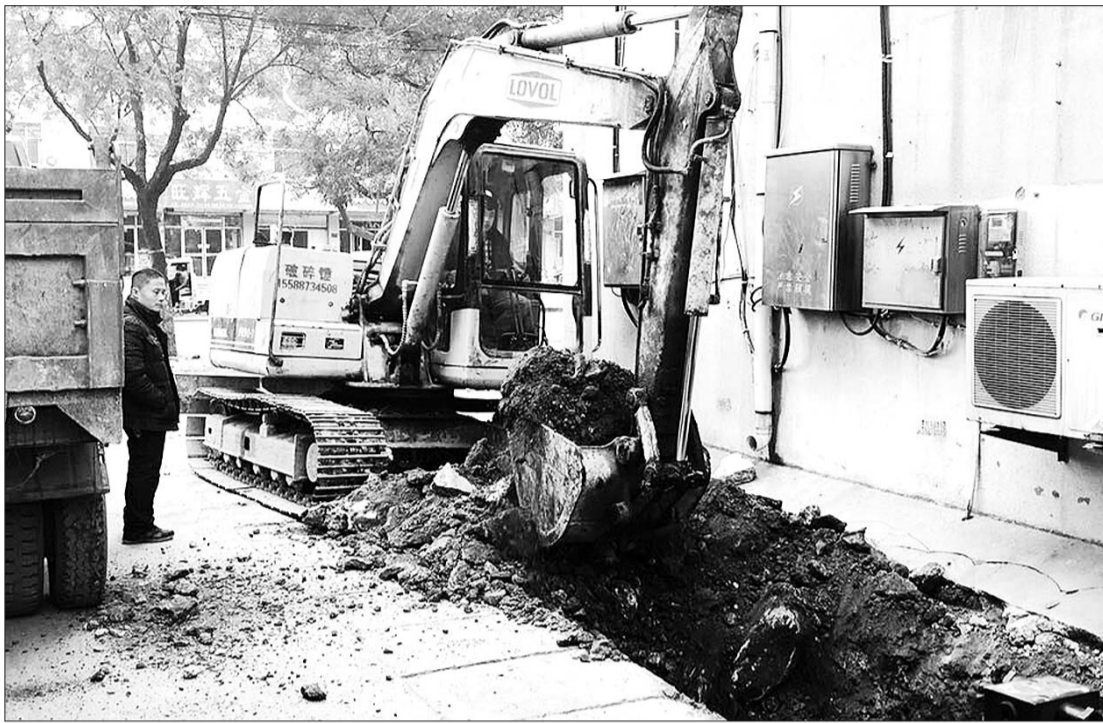
景东园小区外,工作人员正铺设连接管网。本报记者康宇摄

本报济宁11月19日讯(记者 康宇)“我们小区终于要供暖了!”19日,在城区景东园小区暖气管道铺设施工现场,居民王女士高兴地说。在多部门的共同努力下,经过一个多月的等待,该小区供暖管道铺设终于重新开工。预计,景东园小区将于20日下午开通暖气,彻底告别已使用十多年的“土暖”。