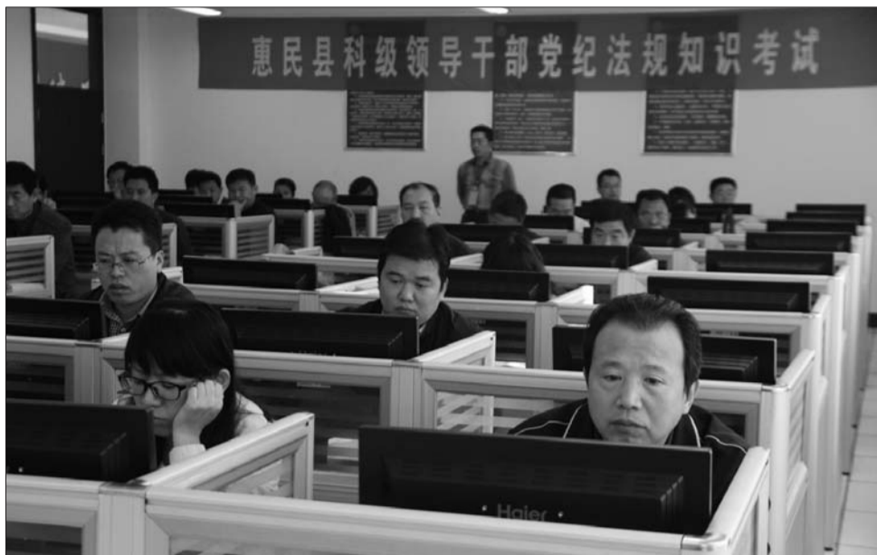
考试现场,全县科级领导干部参加考试。

除了严肃考纪外,县纪委还在报名、考试系统上下功夫,力争每个环节环环相扣,严谨细致,避免考试投机取巧。