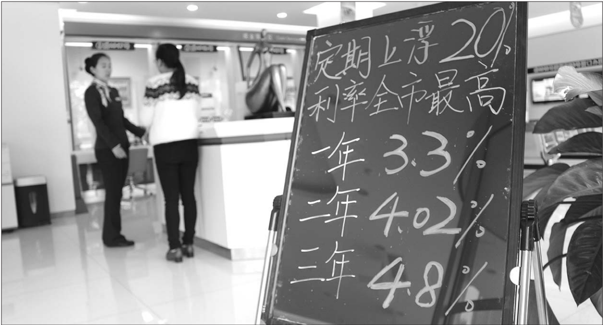
22日,利率新政后,不少青岛市民到银行咨询存款收益问题。