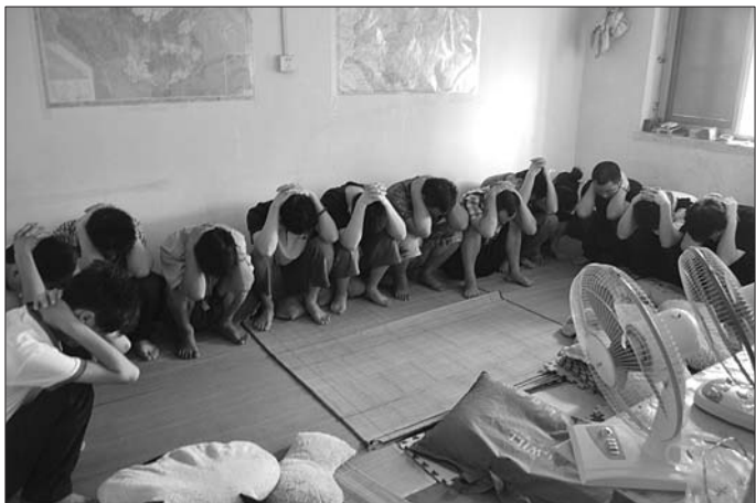
民警抓获传销人员。

25日,在山东省政府新闻办新闻发布会上,省工商局、省公安厅联合通报山东打击传销典型案例和打击传销警示。当前,大规模和公开的传销活动已基本绝迹,“拉人头”等传统聚集式传销活动仍猖獗和顽固。网络传销手段不断翻新,查处打击难度相应增大,加之扩张迅速,隐蔽性、欺骗性更强,仍有蔓延之势。总体来看,我省打击传销工作形势仍然严峻。