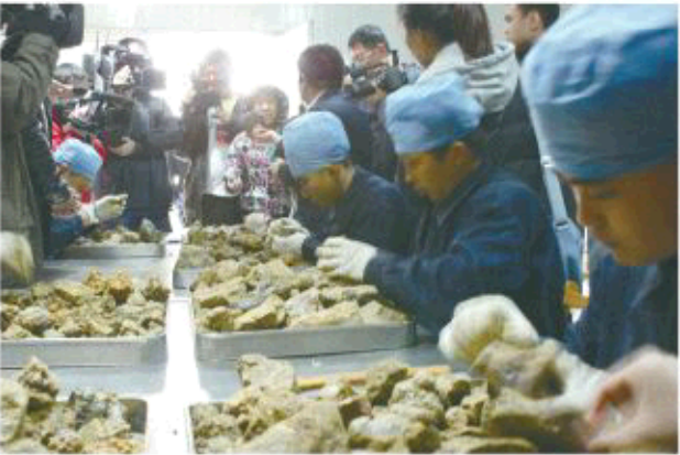
▲媒体、监管领导参观选胶车间

亲临蜂胶生产厂房,零距离体验蜂胶生产的每一个环节!知蜂堂每年都会邀请全国消费代表来北京工厂参观,累计超过一万人次。仅京城济南先后就有8次,近300名消费者代表走进了北京知蜂堂工厂。