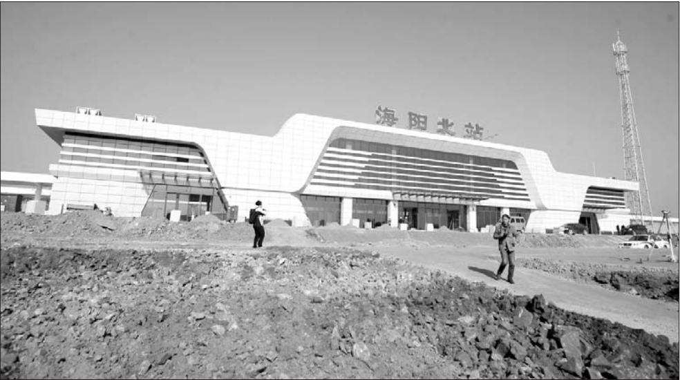
海阳北站以现代建筑风格为主,造型融入海韵金滩、舞动丝带等海阳特色。