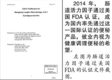
2014年,肠道活力因子通过美国FDA认证,成为国内率先通过这一国际认证的便秘产品,被业内视为健康调理便秘的希望。

据我国流行病学调查,我国国民的便秘发病率约9%-13%,高于世界平均水平。据统计,由于大多数患者对便秘问题重视程度不够,不肯接受正规治疗,以至于目前便秘患者在医院的就诊率还不到10%。