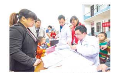
调查显示,我国便秘患者就诊率低,医院就诊率不到10%。

调查显示,我国慢性便秘患者就诊率低,高达72.9%的患者对目前便秘治疗效果不满意。其中,位于前3位的患者不满意原因为“无法有效缓解多种症状”、“起效不够快”和“没有改善排便习惯,未能有效缓解腹胀”。专家呼吁,推进便秘诊疗规范化进程和不断改进便秘疗效势在必行。