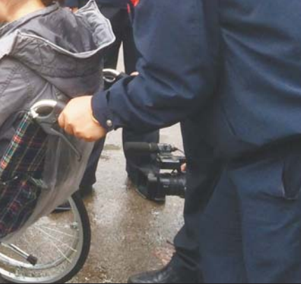
▲轮椅可以直接推上无障碍出租车。