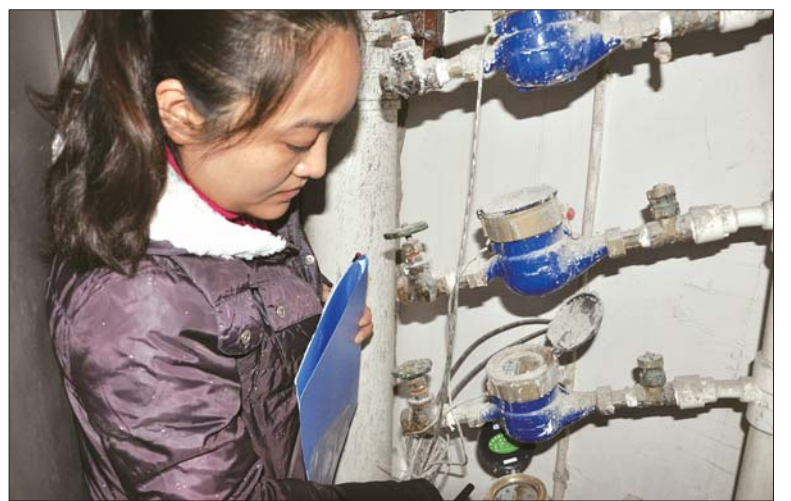
工作人员正在核对水表信息。