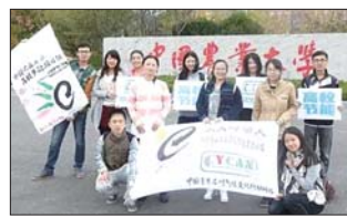
农大学生发起校园低碳节能活动。

本报11月27日讯(记者 李楠楠 通讯员 袁森森) 近日,中国农业大学(烟台“农大绿领人”团队发起的校园低碳节能宣传活动日前正在校园各处展开。活动发起方收集单面打印纸发给同学做草稿纸,网上发布节水节电倡议书,在教学楼饮水机旁张贴低碳节能海报、餐厅电视上播放节能视频,以此唤起师生对低碳节能的重视。