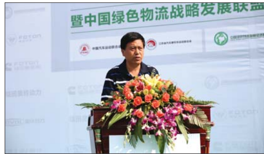
国家体育总局汽车摩托车运动管理中心二部主任中国汽车运动联合会副秘书长姜桐春讲话。

在大区决赛的启动仪式上,还举行了福田汽车奥铃品牌国IV全系列轻卡推广会。在国IV法规全面实施之际,奥铃国IV军团再次在广州集结亮相,意味着广东