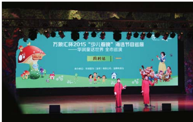
少儿春晚巡演现场。

地,就引起当地轰动,千人爆棚场面上演少儿春晚巡演奇迹。“少儿春晚就是一个让少年儿童展现自己才艺的绝佳舞台,是否成为小明星并不重要,孩子们在期间所经历的成功和失败,所认识的小伙伴,才是成长过程中最宝贵的财富。”一位华润万象汇的负责人说到,华润集团作为76年红色央企,正是秉承着央企的社会责任,鼎力支持本届少儿春晚,希望能为本地少年儿童的成长提供更加多彩的舞台,为整座城市的长远发展储备新生力量和提供持续动力。