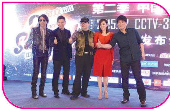
《中国好歌曲》导师亮相。

今年各种各样的户外真人秀将昔日群雄混战的音乐选秀挤了下去。在音乐选秀十年之际,观众最初的新鲜感已丧失,节目到了必须求变的时