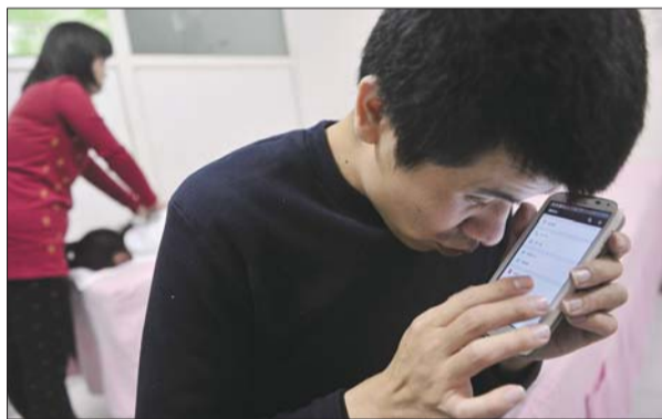
吉刚平时常通过朋友圈、QQ等工具联系客户。