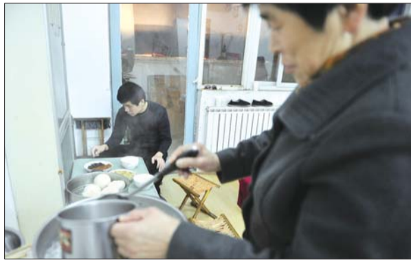
由于吉刚和茜茜视力不行,吉刚的妈妈今年特地从老家来帮着俩人做饭。