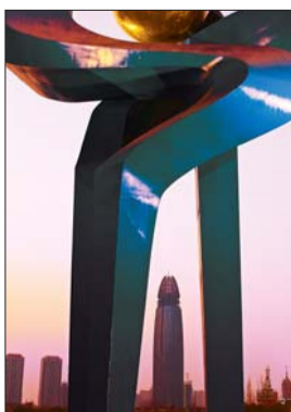
《泉标之下》

来回15天一路走一路拍。还有一次跟我老伴开车去了云贵川,看了黄果树瀑布,元阳梯田和罗布湖等。”