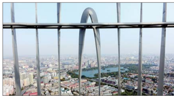
《锁不住的泉城美》

学摄影班学习摄影技巧,还常自驾出游。“有一次跟着自驾队开车去了漠河,途经了呼伦贝尔大草原和大小兴安岭等,