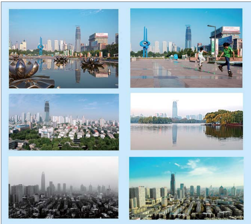
《拔地而起300米》

“第三幅是在三联大厦,那里比较高,拍出的效果好,当时电梯不通还是走楼梯上去的。”在谷老看来,能拍出好的照片,身体的辛劳都不算什么。“第四幅是大明湖里的倒