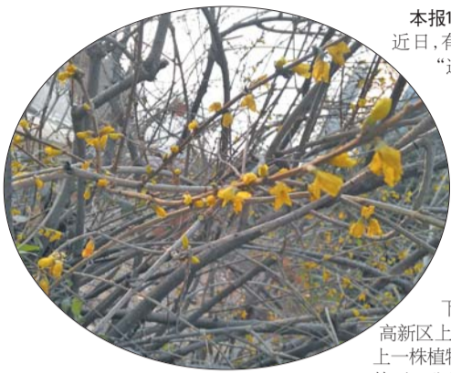
气温已到零下,经十路与舜华南路交叉口西北路旁一棵连翘树仍开着花。

本报12月3日讯(记者 王皇) 近日,有网友发现经十路上的“迎春花”开花了。记者从济南市园林局绿化处了解到,开花的是连翘不是迎春,但冬季开花也比较反常,主要因今年冬季前段时间气温较高,连翘才“受骗”开了花。