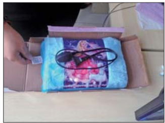
记者打开购买的电热水袋,没有发现合格证和质量认证书。

张医生建议,小孩皮肤比较稚嫩,老人皮肤触感迟缓,这两类人群尽量不要使用电热水袋。大家在使用过程中,不要直接接触电热水袋,要加上隔离套,起到缓冲温度的作用。