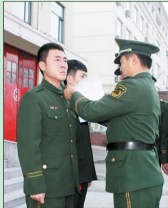
退伍越来越近了，衣服上也没有了军人的标志。指导员您慢点，我想再多带些警衔、领花、胸标，以后就没机会了。