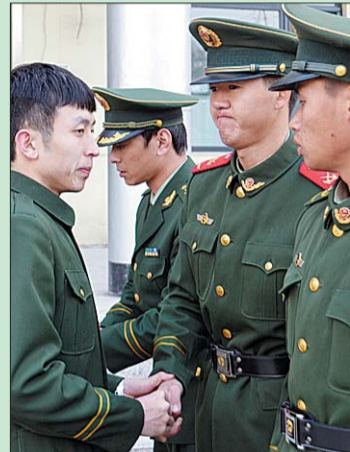
战友，握手吧，再见面不知道是什么时候，心中千言万语却说不出口，保重！