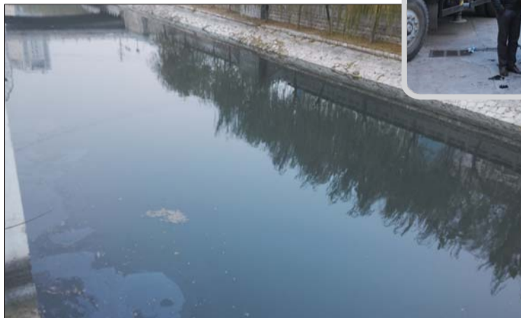
▲污水泵站检修时更换下来的潜水泵。