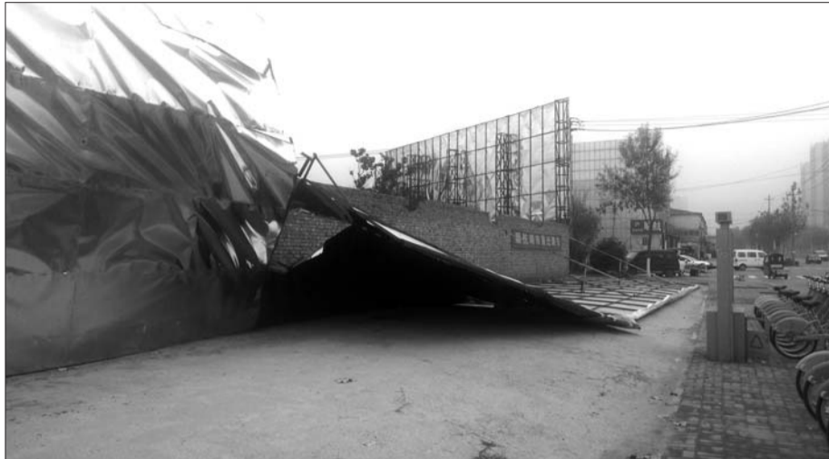
▶30米长的广告牌被吹倒在地。

本报2110110消息(记者 孟杰) 前两天大风降温,太白楼西路与电化路交叉口处一处工地外的大型广告围挡被风吹倒。现在几天过去了,围挡一直无人清理修复。3日,负责该处广告围挡的广告公司到场查看后,表示将尽快修复,并对周围基础围挡进行重新加固。