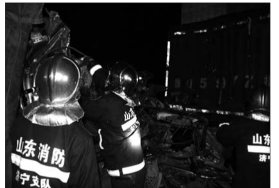
消防队员正在救援。

“发生事故的是两辆外地牌照的货车,后车驾驶室已经被撞扁,副驾驶位置变形很严重,有一人被困。”消防队员介绍,为防止发生二次事故,消防队员设立警戒线并疏导交通,同时使用液压剪对变形的车门进行破拆。20多分钟后,消防队员将被困人员救出,送上救护车。目前,事故原因正在调查中。