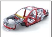
GAC安全车身全方位主动被动安全 尖端科技1.8T涡轮增压发动机