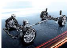
四轮独立悬挂豪华底盘