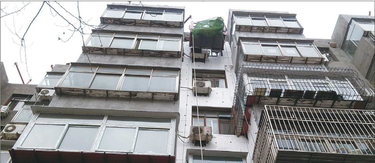
在玉函北区,部分楼座的外墙体保温施工正在收尾。

记者了解到,玉函北区供暖问题一直是该区居民反映的热点问题。该小区大多是20世纪90年代建成的老楼,此前缺少保温层。根据相关政策,应该先进行节能改造还是先进行供暖管网施工,热电公司和建委方面规定不统一。不过,双方最终达成一致,今年11月份,节能改造和供暖管网施工同步开工。