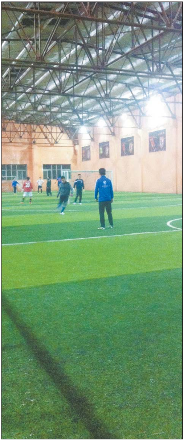
解放东路一家室内足球场地。