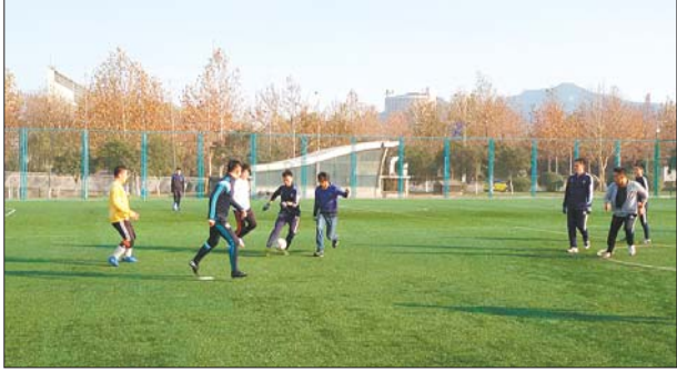
在省体踢球的足球爱好者。

11月26日,全国青少年校园足球工作会议中,提出足球成为体育必修课,纳入学生综合素质评价的构想,有关部门也将要出