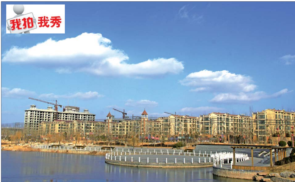
蓝天白云见证着商河的发展,希望有一天楼盖起来了,蓝天白云仍在。

深陷藤椅中的我啊 是薄雾笼罩的迷茫 是渐去渐远的困惑 是丁香般的枯黄 是茉莉的凋谢 是沉思 是静坐 是更难消弥的沉默 深陷藤椅的我啊 如今 唯爱这早至的 暮色