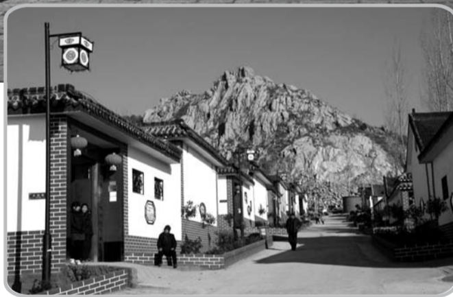
▲泗张镇王家庄村特色农家乐远近闻名。