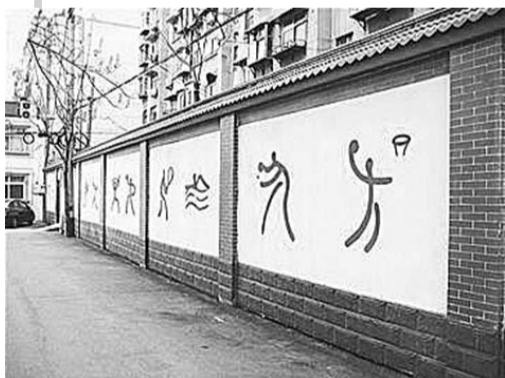
济南为举办全运会建设的文化墙