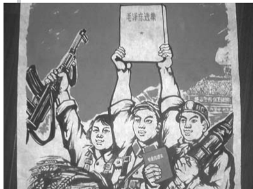
上世纪60年代的文化墙